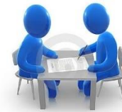
Личное обращение в ведомство